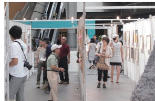
出品作品 展示風景