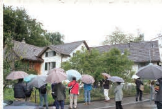
複数家族の住居(スイス)