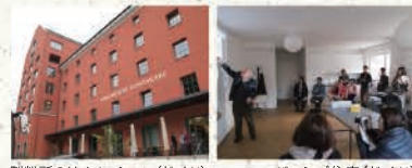
製粉所のリノベーション(ドイツ)