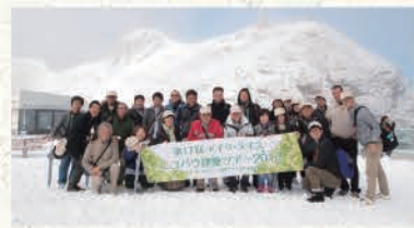
エコバウ建築ツアー2013(スイス)

スイス・ドイツの古い教会(プロテスタント教会・カールスルーエ)やリノベーション住宅、最先端のパッシブ ハウスを目の当たりにし「住まい継げる建物とは何か?」を深く考える機会となりました。ドイツでは人の 健康によい環境建築を「パウビオロジー」、地球環境や自然に優しい建築を「パウエコロジー」として分類され、 その2つが今のドイツの建築に深く関わっています。未来を担う子ども達のために、環境に配慮し、安心して 住まえる住宅と、より良い自然環境を後世に残していこうという考え方で。