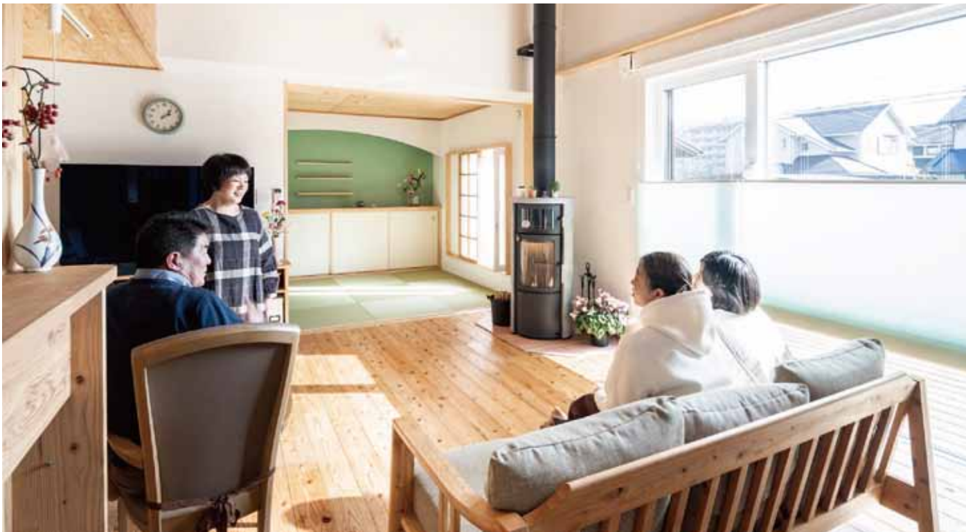
床：リボス アルドボス

ご主人はさまざまなハウスメーカーや工務店の家づくりを見て学ぶうちに断熱性の高さだけでなく、自然素材の魅力や家づくりに携わる職人の技、手間を掛けることの価値を意識するようになったといいます。「ビニールクロスなどは、最初はきれいですが時間が経つにつれ劣化していきますよね。でも自然素材は劣化というよりも味わい深くなっていくように感じます。」結局ご主人は、こうした価値感を共有できる設計事務所「空設計工房」に家づくりをお願いすることにしました。