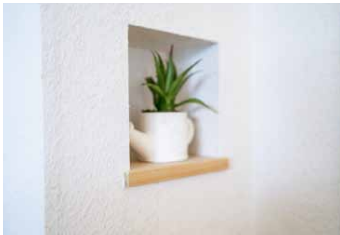
壁：オガファーマー ミックス