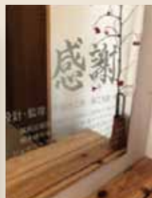
玄関の鏡には建築に関わった業者さん達への「感謝」の言葉