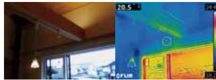
撮影は2020年12月29日14時(外気温15℃)。朝の冷えている時間帯(最低気温5℃)を過ぎて暖房を切ってから室内は無暖房。

Mさんご一家は、2020年7月に引渡し、8月の1ヶ月間気温30℃超えの猛暑、酷暑だったにも関わらず、小さなエアコンだけで過ごせたとも話してくださいました。「寒かった今年の1月初旬、外気温-4℃で積雪したときでも、明け方の室温は18℃を下回ることもなく、そういう夏も冬も家の中であまり温度差を感じません。あと、空気がきれいな感じがして、夏でもムツとした感じがありませんでした。」ご主人は夏場の湿度を記録されていて、 ほぼ湿度は60%前後に抑えられていた ので、家が完成する前から断熱性や熱容量、透湿性の高さの恩恵を享受されていたということでした。「おかげで夏のDIYも楽にできました。建築中の大工さんも仕事しやすいとしきりにおっしゃっていましたね。」設計された江藤さんが撮影されたサーモカメラの画像からも、家中の壁の表面温度が いずれも20℃前後 を示しており、温度差がないことがよく分かります。ご主人は「今後はさらに暑さや寒さが厳しくなるように思いますから、断熱性の高さだけでなく、熱容量や透湿性といった要素も必要性が増しているのではないですか。」と取材の最後にお話して下さいました。