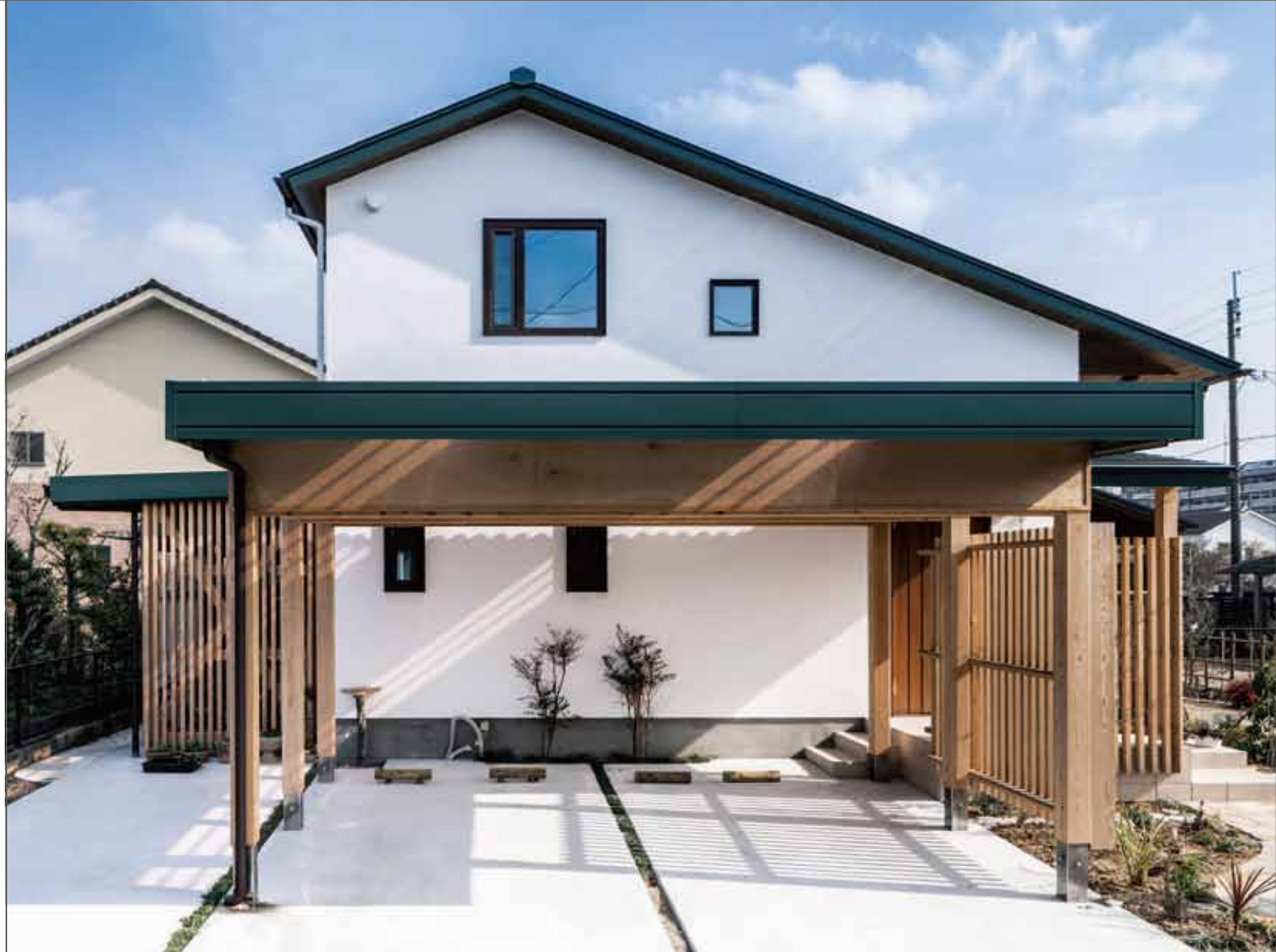
外壁：カルクファサード