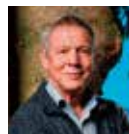
【講師プロフィール】 ヘルマン・ブルーマー

1943年生まれ。スイスの木造エンジニア。大工の職業教育を受けた後、連邦工科大学での建設エンジニアを修了。実家の木造会社の経営に携わる側ら、多くの木質建材や構法を開発。クリエイティブな中大規模の現代木造建築に特化し、普及活動に献身。2005年に坂茂氏に出会った事に始まり、ヘレン&ハルトといった世界的建築家のパートナーとして、著名な現代木造建築作品の実現を支える。現代木造技術大国のスイスにおけるパイオニアでありカリスマ的なエンジニア、発明家であり企業家。 www.hermann-blumer.ch