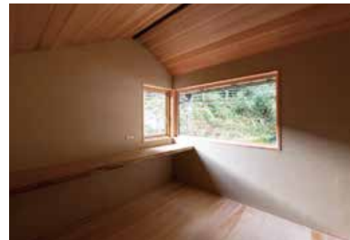
シュタイコが静謐な空間を創る

「まだ季節を一巡しただけですが、シュタイコの蓄熱性と吸放湿効果をこの冬で体感しました。断熱改修前で湿度や温度の変化があった昨年の今頃より、今年の方が過ごしやすく温熱環境が安定しています。シュタイコが1年かけてこの場所に順応したといつか、