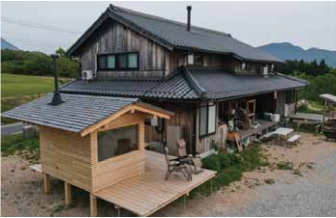
石川県より移築改修した古民家(自邸)には大山を望むサウナ小屋も備わる