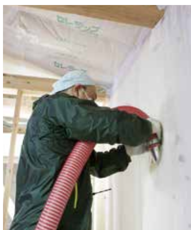
ドイツ製のブロワーでシュタイコゼルを吹き込む

創伸では新築の場合、性能面ではUA値が0.4前後、ウルト社の透湿防水シートで外側の気密