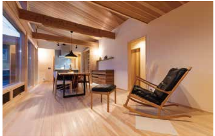
伝統構法とシュタイコを用いた平屋はモダンなインテリアで落ち着いた空間