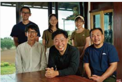
現在は2人のスタッフが加わり8人のチームで「住まい手と職人が一体となった建物」を建てる。